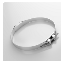
Collier à tourillons, Acier de qualité W4, acier inoxydable 1.4301 Collier spécial pour la serrage de tuyaux en spirale moyens et lourds aux pièces de raccordement des installations mobiles et stationnaires