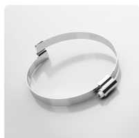
Collier Master-Grip à visser, Acier de qualité W4, acier inoxydable 1.4301 Collier spécial pour gaines Master-Clip