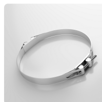
Collier à tourillons Collier spécial pour la serrage de tuyaux en spirale moyens et lourds aux pièces de raccordement des installations mobiles et stationnaires